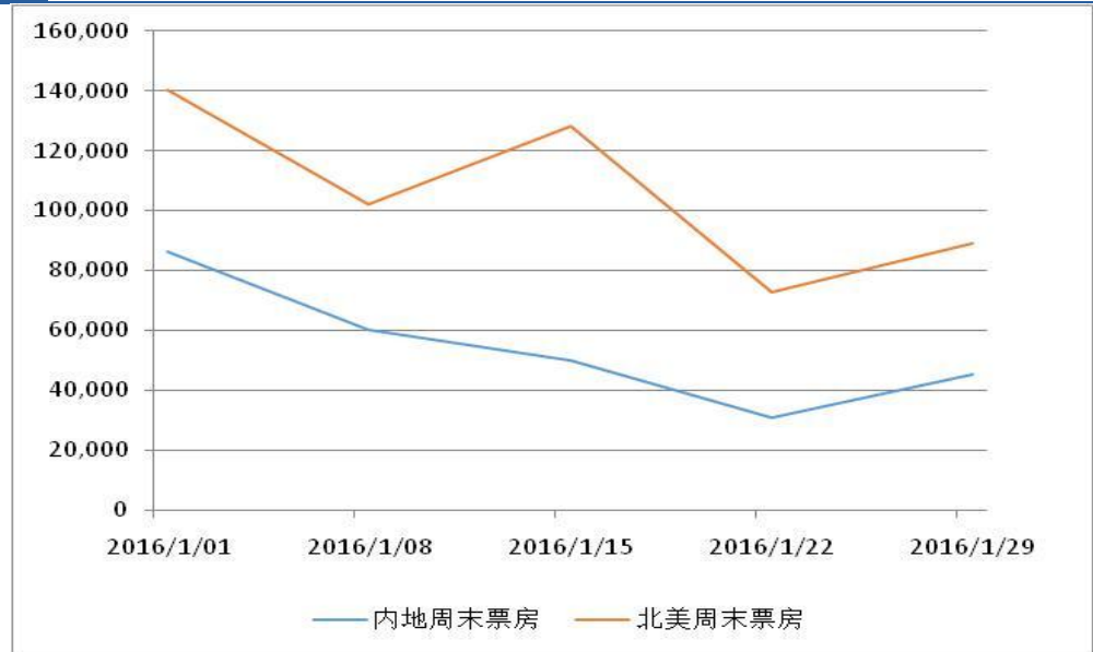
图 1: 中美 2016 年 1 月周末票房对比 (万)