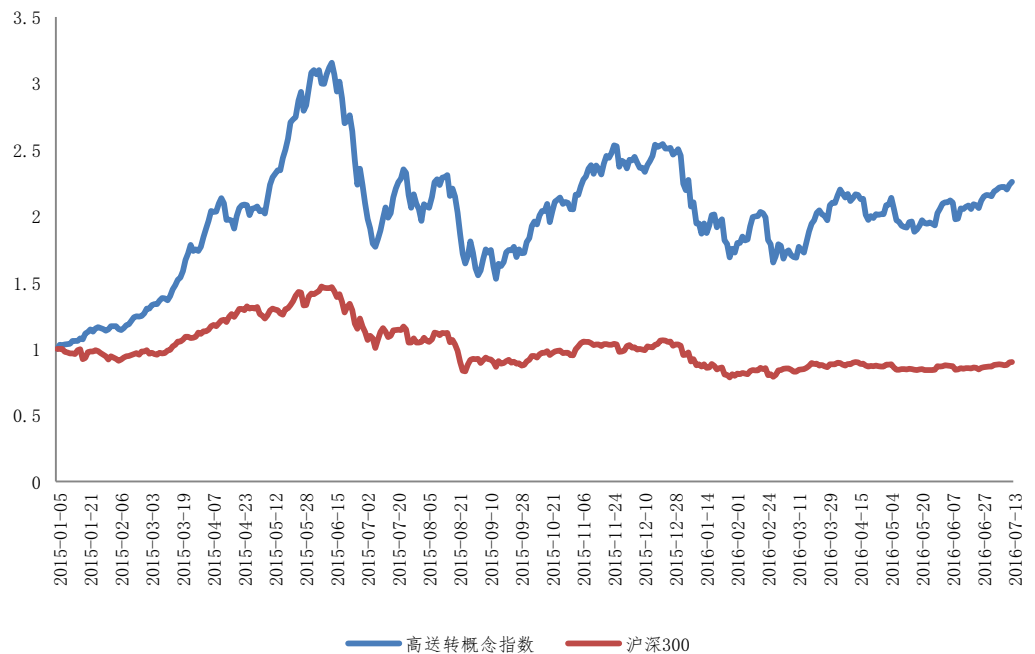
图 1: 高送转概念指数与沪深 300 对比